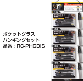
ポケットグラス ハンギングセット 品番：RG-PHGDIS