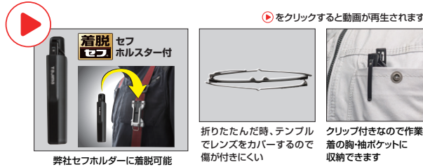
弊社セフホルダーに着脱可能