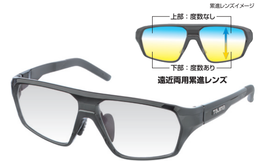
遠近両用累進レンズ