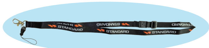
スタンダード製ストラップ