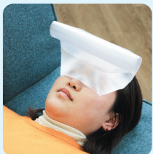
氷を入れて氷のうにも