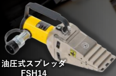
油圧式スプレッダ FSH14