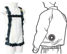
■体と保冷剤の接点温度