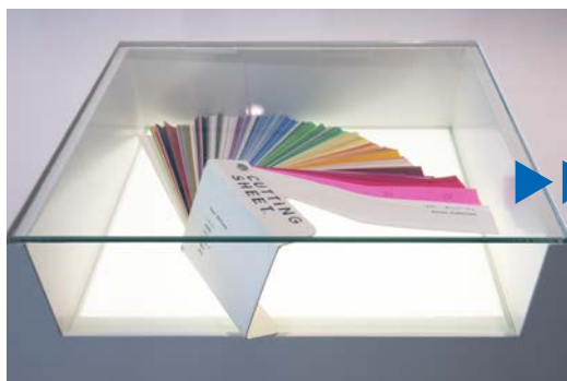
<展示什器ガラス面への施工>