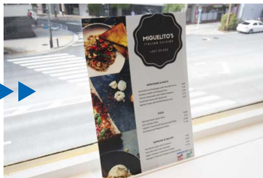
直接貼る事で色目を変える事なく抗ウイルス加工を施せます