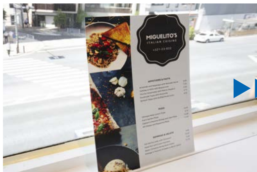
<メニューボードへの施工>