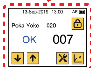
(背面)2.2インチ (イメージイラスト) タッチスクリーン

※お知らせ：初期販売モデルには、「無線通信機能」は付属しておりません。 後日、無償取り付けをPOPインフォメーションにてご案内します。