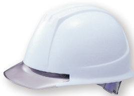
DPM-141JW/GY (バイザー色:透明グレー)