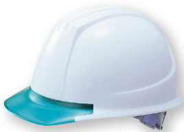
DPM-141JW/GN (バイザー色:透明グリーン)