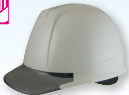
DPM-141JGY/GY (バイザー色:透明グレー)