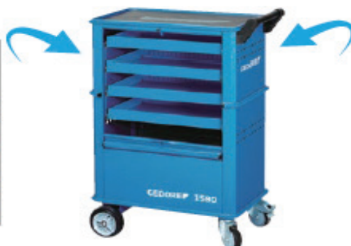
ツールローリー引出4段 品番: 6627550