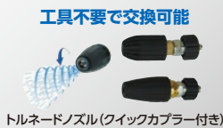
トルネードノズル(フックカバー付き)