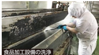
食品加工設備の洗浄