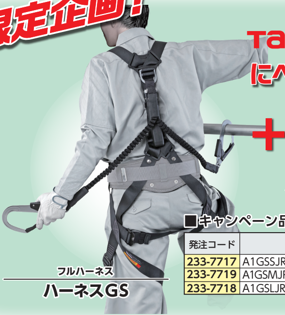
フルハーネス ハーネスGS