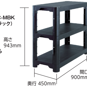
TPT-3343C-MBK (つや消しブラック)