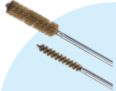
パーツイスター® 真鍮線