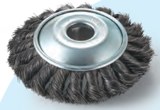
ノット型ベベルブラシ エアー用