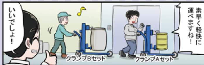
★漫画は、双頭型（オーダーメイド製品）の事例です。