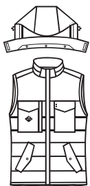
フロントスタイル